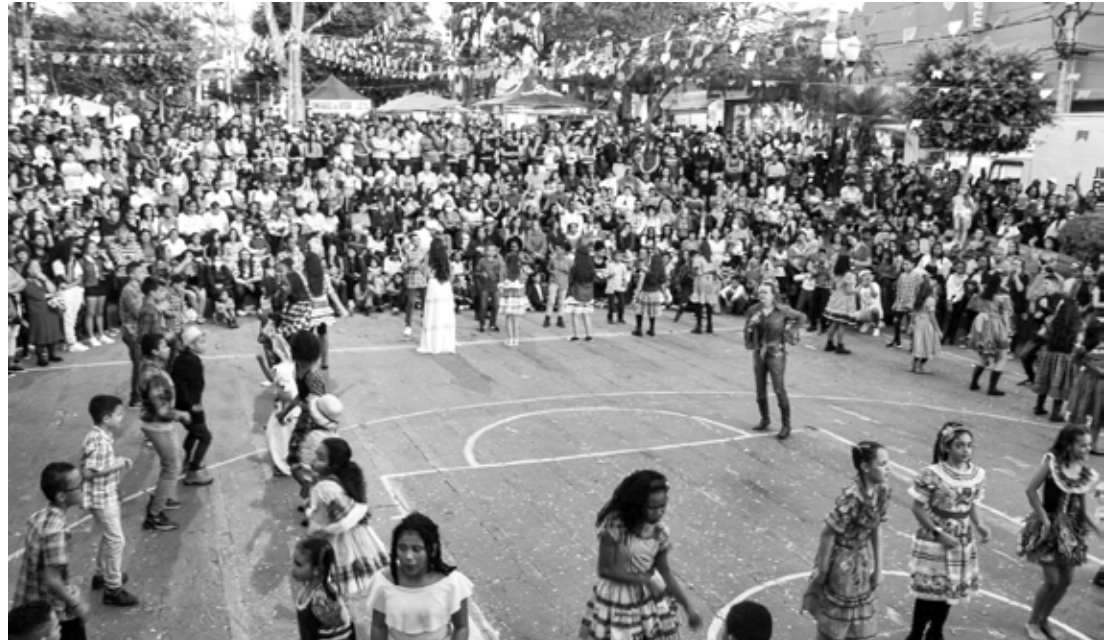
Crianças dançam quadrilha na Praça Antônio Carlos