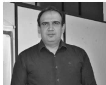
Entrevista foi concedida semana passada

Sou professor da rede estadual de ensino de Minas Gerais há mais de 20 anos e percebo essas necessidades em sala de aula. Ainda não sabemos quais serão as profissões do futuro, mas, sabemos que o perfil exigi-