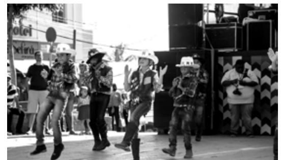
Crianças apresentam número de dança