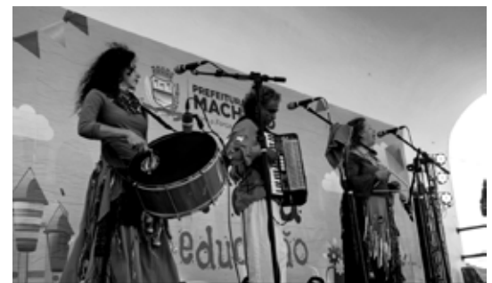
Zabumba, triângulo e sanfona na festa