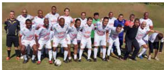
Máster do Instituto Urubola, o 'Bola Preta'