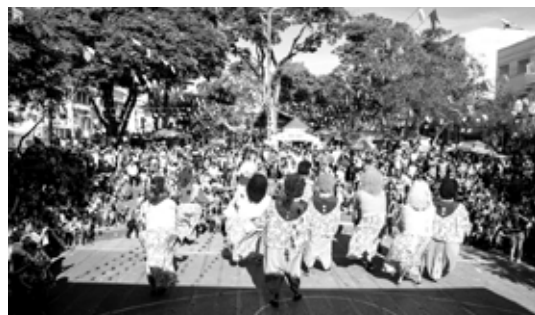
Bonecões da Mantiqueira alegraram o evento