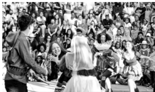
Depois de dois anos, eventos voltam ao centro